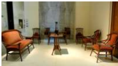
Modo de vida